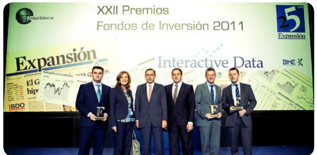
L'equip d'inversions de VidaCaixa amb els tres premis atorgats pel diari Expansión .

D'altra banda, Morningstar i "elEconomista" van lliurar a VidaCaixa el Premi al millor Pla de Pensions de Renda Fixa per "PlanCaixa Ambició". Aquesta categoria concentra el 42% del patrimoni total gestionat en plans de pensions a Espanya. Entre els aspectes més destacats que han decantat la seva elecció, destaca el manteniment de la rendibilitat del producte en els últims cinc anys i el fet d'haver aconseguit rendibilitats superiors a les de productes similars de la competència en almenys tres dels darrers cinc anys.