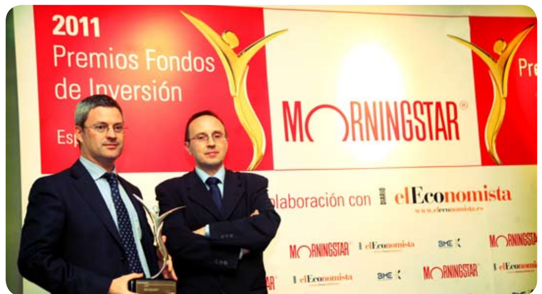
Recollida del guardó de "elEconomista" al millor Pla de Pensions de Renda Fixa.